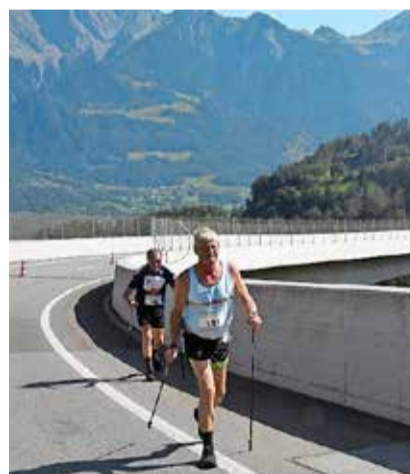
Leiden auf der Brücke: Der Brückenlauf fordert den Teilnehmenden alles ab.